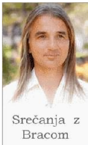
Srečanja z Bracom